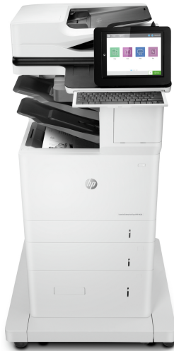
МФУ HP LaserJet Enterprise Flow M636z

Это МФУ HP LaserJet с технологией JetIntelligence сочетает в себе исключительную производительность, пониженное энергопотребление и надежную печать документов профессионального качества, при этом защищая вашу сеть от атак с помощью лучших в отрасли средств обеспечения безопасности HP 1 .