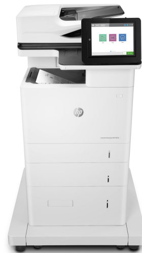
МФУ HP LaserJet Enterprise M636fh

Принтер с поддержкой динамической безопасности. Предназначен для использования только с картриджами, оснащенными оригинальной микросхемой HP. Картриджи с микросхемами других производителей могут не работать, а работающие в настоящее время могут не работать в будущем. Подробнее см. на веб-сайте по адресу: http://www.hp.com/go/learnaboutsupplies