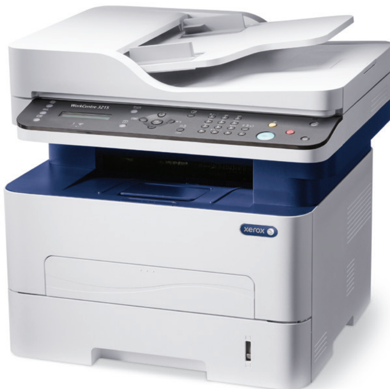
WorkCentre 3215. Копирование. Печать. Сканирование. Факс. Электронная почта.